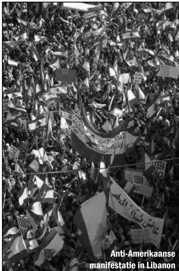
Anti-Amerikaanse manifestatie in Libanon

ACHCAR: Jammer genoeg heeft een groot deel van de radicale en westerse linkerzijde een sim-