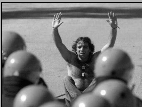
Enkele foto's van het protest tegen de G8 in Genua, 2001