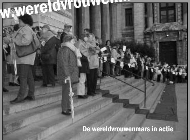
De wereldvrouwenmars in actie