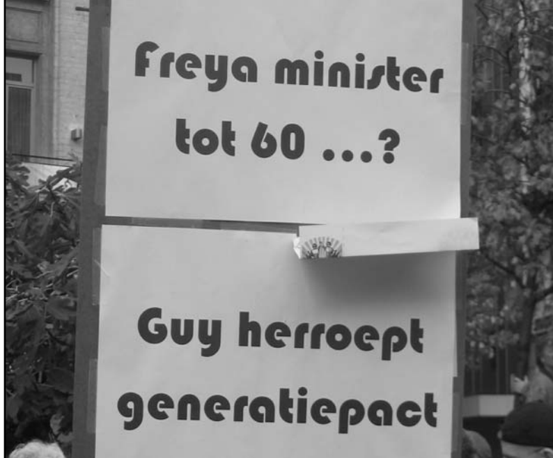
Sleeckx: "De strijd tegen het generatiepact vormde een sleutelmoment, een moment waarop de basis de politiek in handen wil nemen."

Ik denk dat er een alternatief moet komen, dat zich oriënteert op de werkende mensen en de sukkelaars.